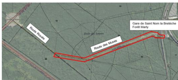
Plan de situation : route des Muses à L'Etang la Ville

Le parking de la gare situé sur la Route des Muses doit permettre le passage des modes actifs. Un abaissement de la vitesse est requis pour permettre le croisement des bus et une meilleure sécurité.