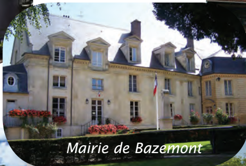
Mairie de Bazemont