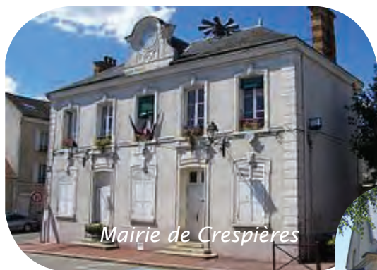
Mairie de Crespières

Élaboration et suivi d'un schéma directeur des circulations douces.