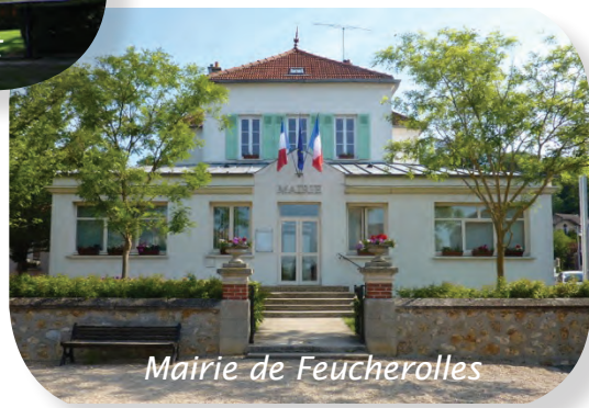
Mairie de Feucherolles