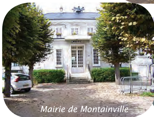
Mairie de Montainville