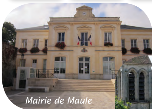
Mairie de Maule