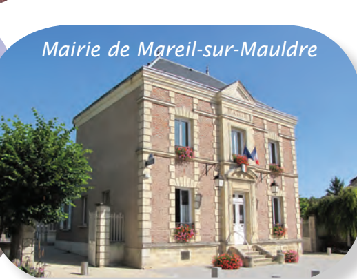
Mairie de Mareil-sur-Mauldre