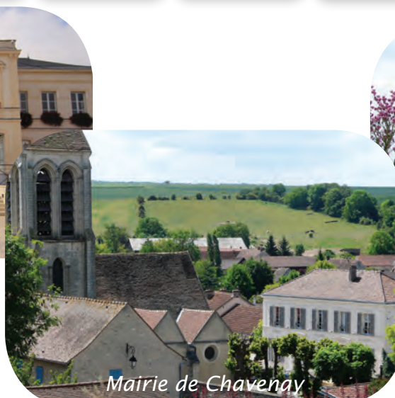
Mairie de Chavenay