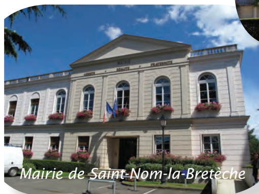
Mairie de Saint-Nom-la-Bretèche