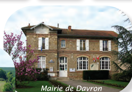
Mairie de Davron