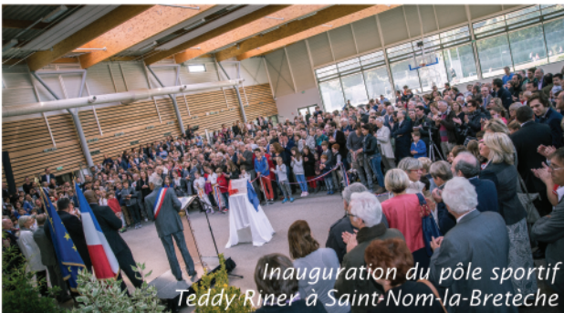
Inauguration du pôle sportif Teddy Riner à Saint-Nom-la-Bretèche