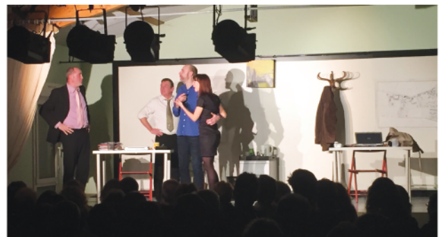
Février 2016 : Théâtre à Andelu «LE COACH»