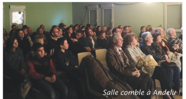
Salle comble à Andelu !

Bulletin intercommunal de la Communauté de communes Gally Mauldre