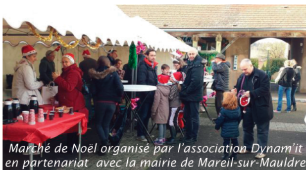
Marché de Noël organisé par l'association Dynam'it en partenariat avec la mairie de Mareil-sur-Mauldre