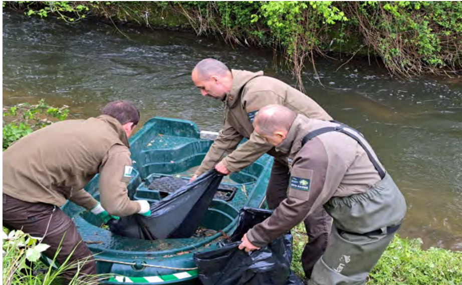
Opération nettoyage de la Mauldre à Mareil sur Mauldre